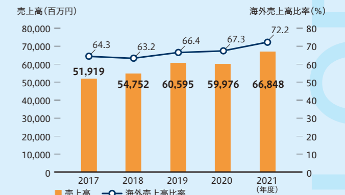
▼ 売上高・海外売上高比率