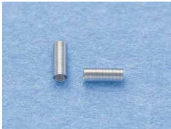
不透過マーカコイル