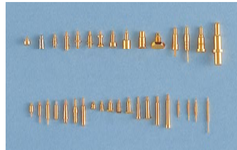
スプリングコネクタピン