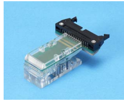
B to Bクリップ 0.4mmピッチ対応「表当て版」 【CCBBシリーズ】