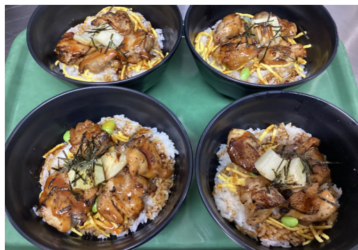
ハラルメニューの例

株式会社ヨコオ(本社:東京都千代田区、社長:徳間 孝之)は、富岡工場の社員食堂「Y's Cafeteria Sky Oasis(ワイズ カフェテリア スカイオアシス)」において、マレーシア研修生のムスリム社員(イスラム教徒)向けに、2023年11月13日にハラルメニューの提供を開始してから1年が経過したことをお知らせします。