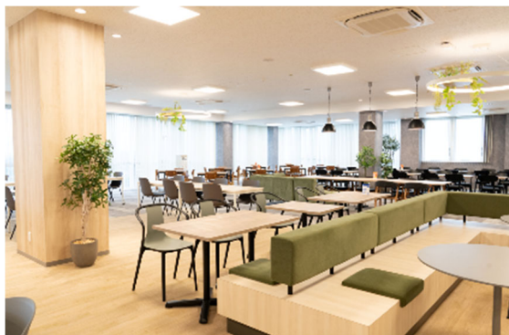
富岡工場食堂「Y's Cafeteria Sky Oasis」

株式会社ヨコオ(本社:東京都千代田区、社長:徳間 孝之)は、富岡工場の社員食堂「Y's Cafeteria Sky Oasis(ワイズ カフェテリア スカイオアシス)」において、マレーシア研修生のムスリム社員(イスラム教徒)向けに、2023年11月13日にハラルメニューの提供を開始してから1年が経過したことをお知らせします。