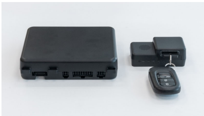
車載 IoT ソリューション(鍵開閉システム)

～ スマートバリューの「Kuruma Base」を通じ、ガッツ・ジャパンの新サービスに採用 ～