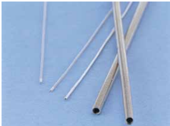
ガイドワイヤ用コイル／カテーテルシャフト用コイル